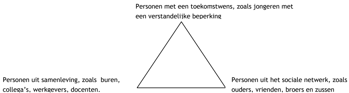
Figuur 1 Ondersteuning bij het realiseren van een toekomstwens moet in balans zijn (Van Boheemen, 2004).

worden voorkomen. Het draait om het zorgen vóór elkaar en mét elkaar (zorg in termen van ondersteuning en support). De beschikbare hulp, tijd en energie van betrokkenen moet niet enkel naar de persoon met de beperking gaan, maar gedeeld worden met anderen. De ondersteuning aan betrokken partijen moet in balans zijn; zorg voor balans, balans in zorg (zie figuur).